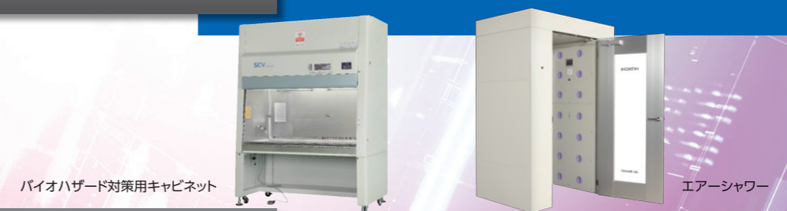
バイオハザード対策用キャビネット