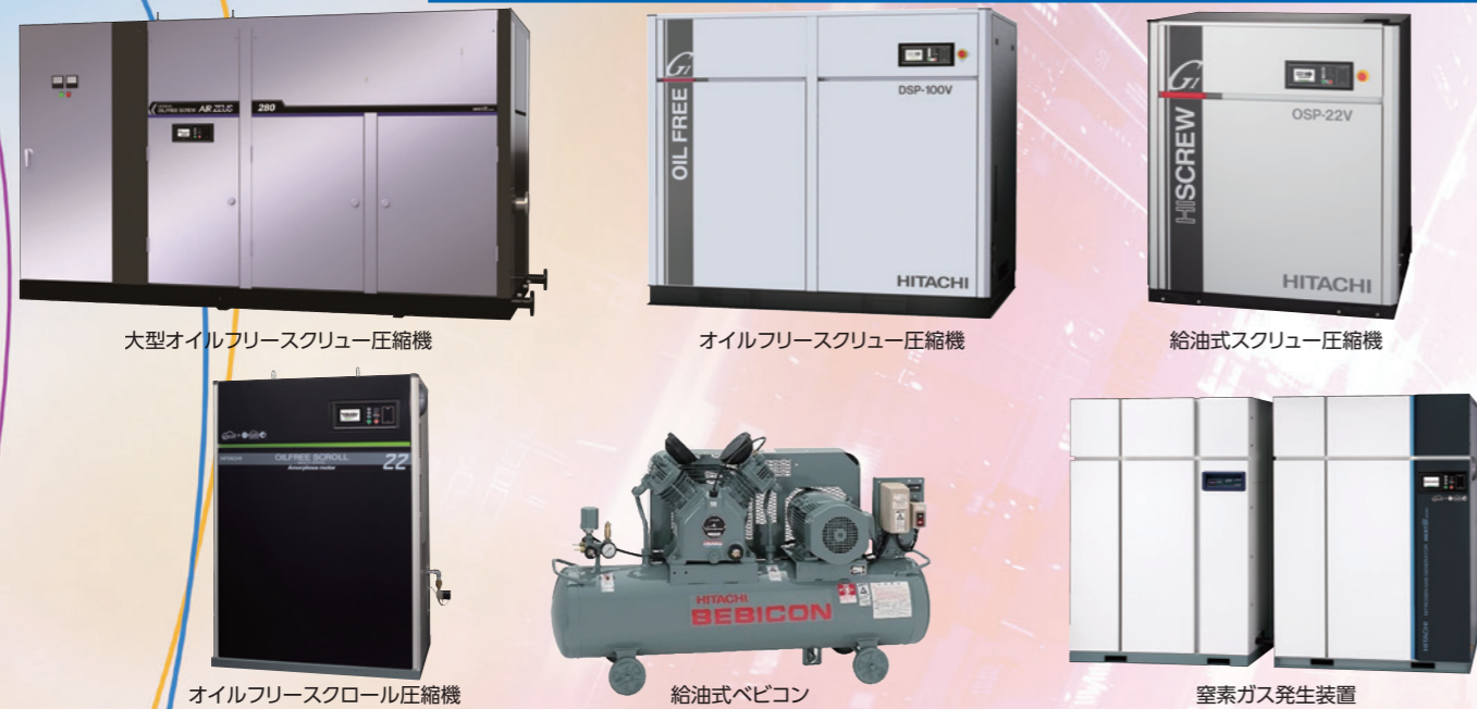
大型オイルフリースクリュー圧縮機

空気圧縮機はモノづくり現場をはじめ、さまざまな産業分野で動力源や搬送用など、多様な用途の圧縮エアを供給する重要な役割を担っています。日立はオイルフリー / 給油式ともに、大型から小型までラインアップ。さらにIoT対応のクラウド監視サービスによる保守管理で、お客様機器のライフサイクルコストの低減に貢献します。