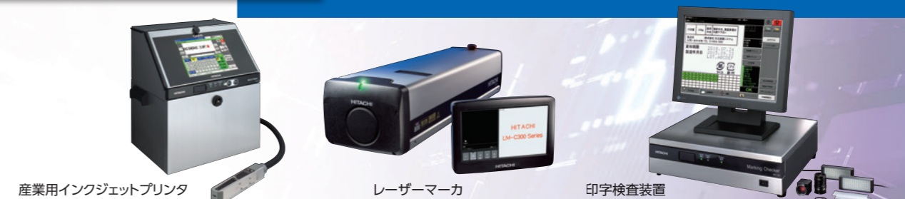
産業用インクジェットプリンタ

食品・薬品・化粧品の使用期限や電子部品へのロット印字による生産管理・品質管理・トレーサビリティ管理をサポートします。