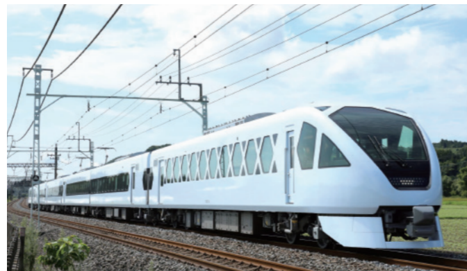
東武鉄道／新型特急スーパーシア X

鉄道の安全・安定輸送、サービスを支える車両及び電気品の販売、 車両改造の提供、アフターサービスまで幅広く対応しております。