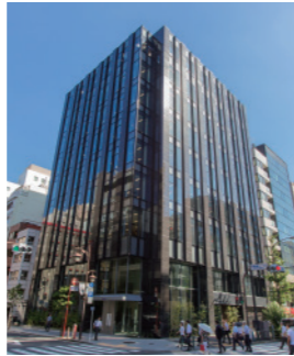
2016年9月に新本社ビルが完成いたしました。

商号 八洲電機株式会社 Yashima Denki Co., Ltd. 所在地 本社 〒105-8686 東京都港区新橋三丁目1番1号 創立年月日 1946年8月8日 資本金 1,585百万円(2023年3月現在) 売上高 連結 60,270百万円(2023年3月期) 従業員数 連結 980名(2023年3月現在) 取引銀行 三菱UFJ銀行 みずほ銀行 伊予銀行 上場証券取引所 東京証券取引所 プライム市場(証券コード:3153) 登録 ●一級建築士事務所 東京都知事登録:第61249号 登録年月日:令和3年12月5日 建設業許可 ●特定建設業 建設業の種類:土木工事業、建築工事業、とび・土工工事業、屋根工事業、電気工事業、 管工事業、鋼構造工事業、舗装工事業、塗装工事業、防水工事業、 内装仕上工事業、機械器具設置工事業、電気通信工事業、水道施設工事業 許可番号:国土交通大臣許可(特-2)第5842号 許可年月日:令和2年12月17日 ●一般建設業 消防施設工事業 許可番号:国土交通大臣許可(般-2)第5842号 許可年月日:令和2年12月17日