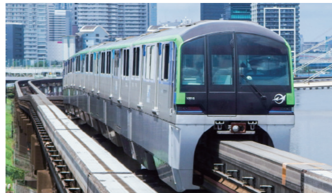
東京モノレール／10000形車両