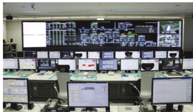
電力管理システム

主要取扱製品 受変電設備（ガス絶縁開閉装置、変圧器、整流器、遮断器、配電盤等）、 電力管理システム、回生電力吸収装置