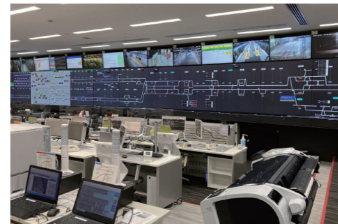
運行管理システム

列車の安定輸送に必要な不可欠な信号設備や、情報通信技術を活用 した製品・ソリューションを提供し、乗客の快適性向上と設備の安定 稼働に貢献いたします。