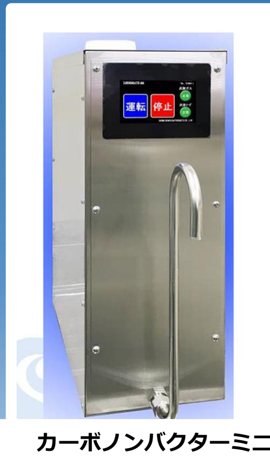
カーボンバクターミニ