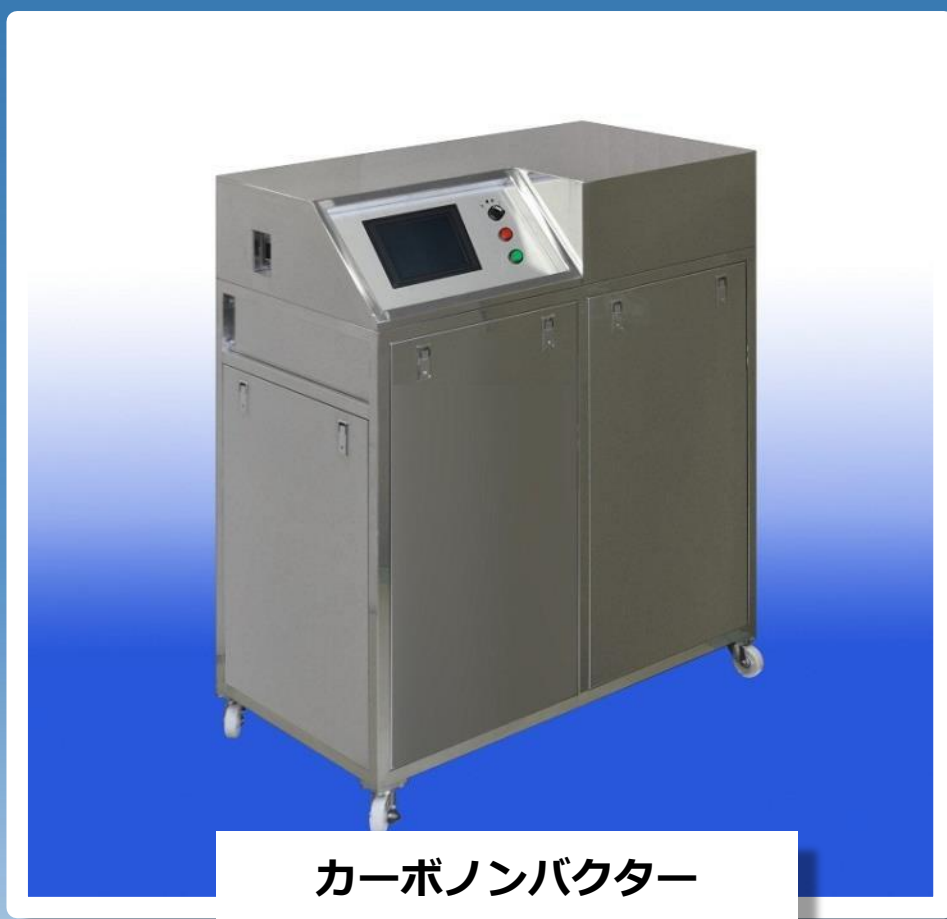
カーボンバクター